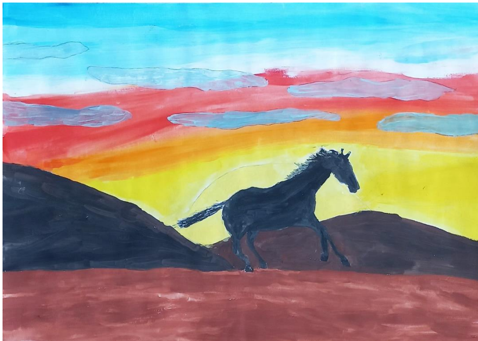
Aleksis Gulja, 7. a

V primeru, da se ob začetku šolskega leta posamezni učenec premisli in želi zamenjati dejavnost, je menjava možna v mesecu septembru tekočega šolskega leta, vendar le v okviru normativno predpisanega števila učnih skupin oz. do popolnitve posamezne učne skupine.