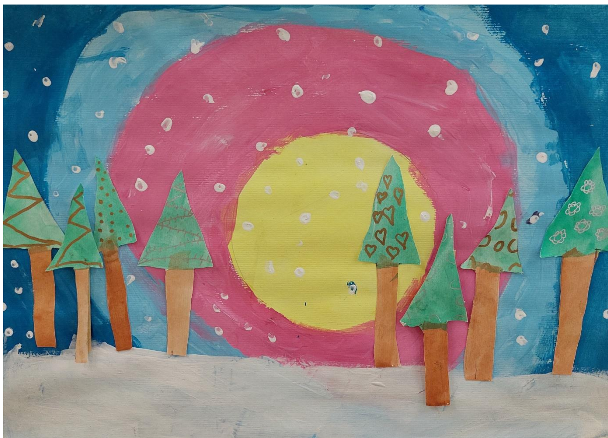
Natalija Gulja, 2. a