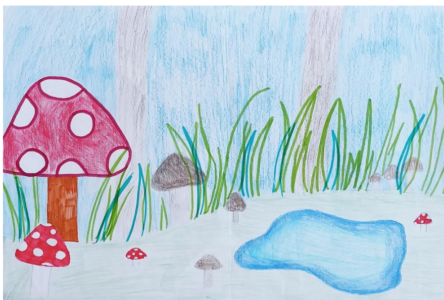
Neja Prelec, 7. a