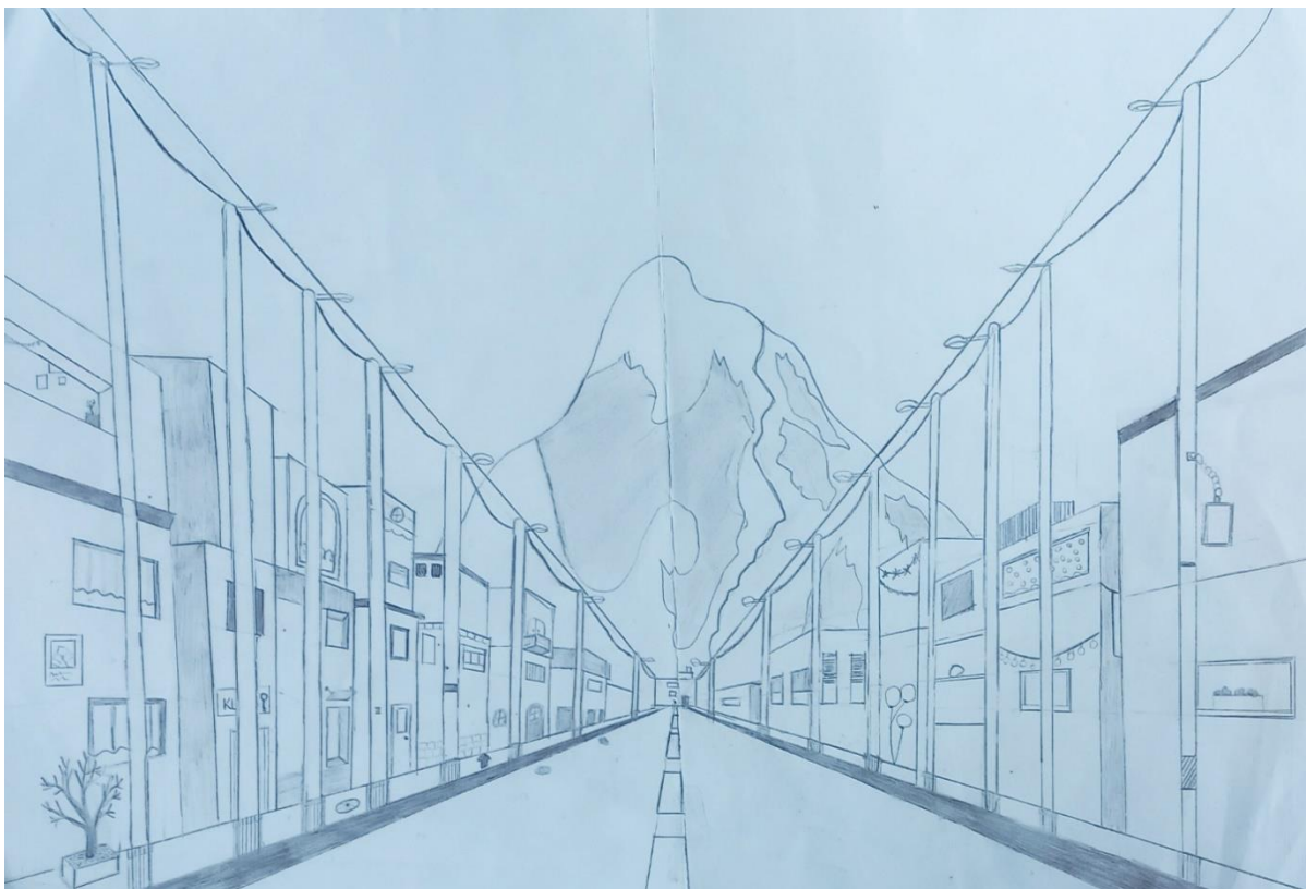
Ines Nika Sluga, 9. b