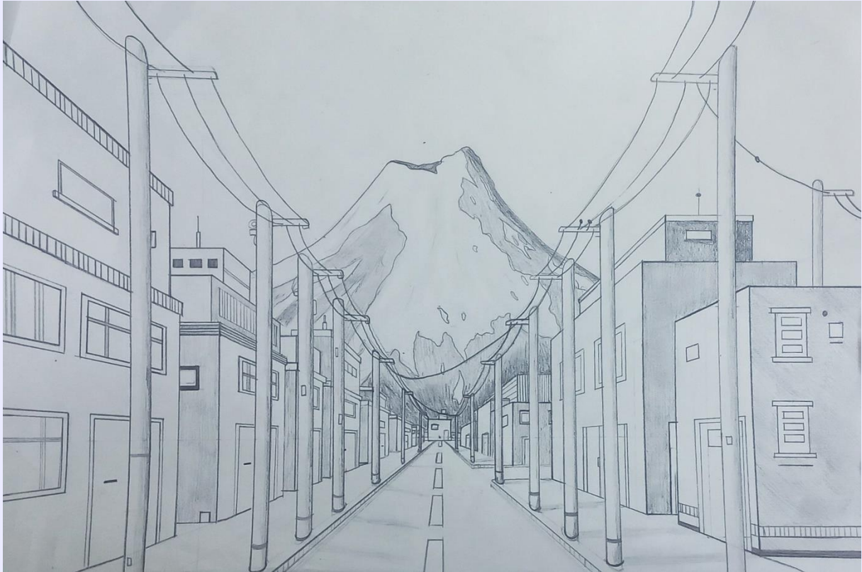
Žana Šajn, 9. b