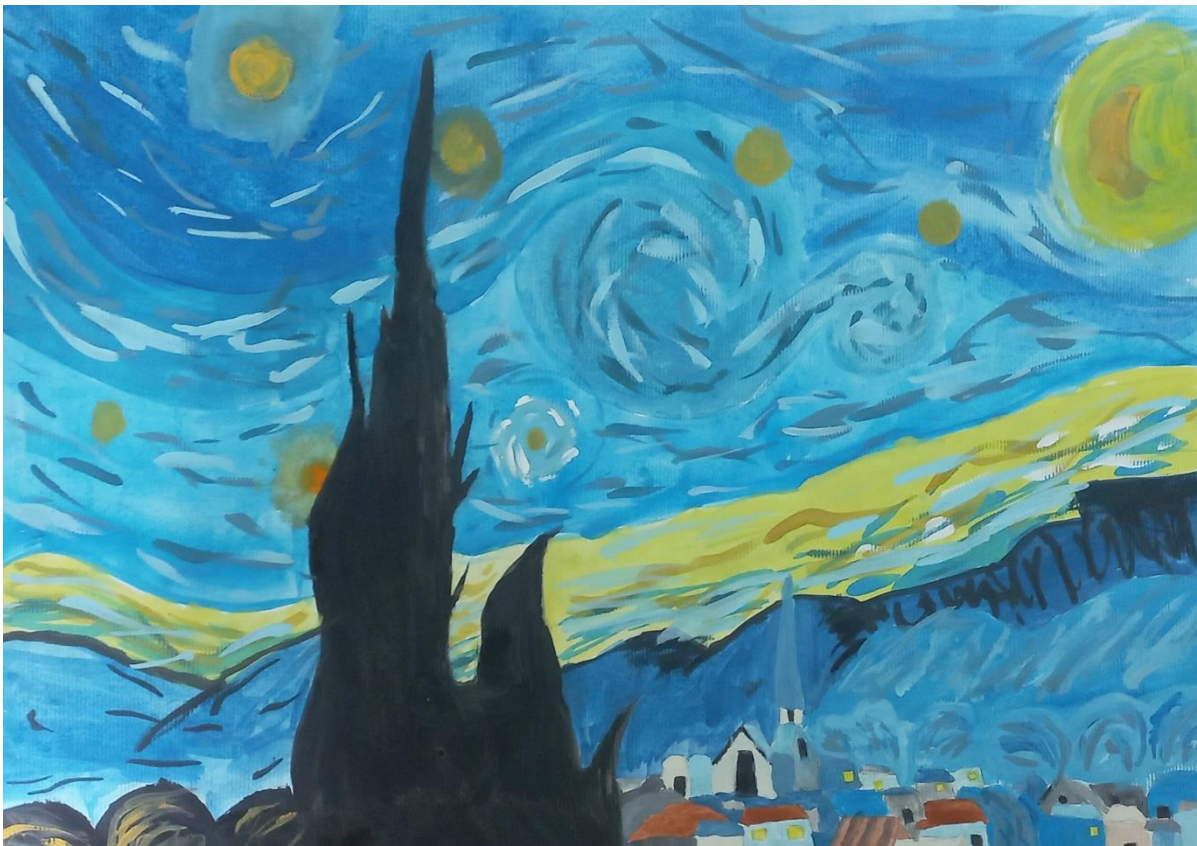
Ian Poklar, 7. b

Učenci razpravljajo o temi, ki so jo njihovi vrstniki izbrali na državnem otroškem parlamentu. Izbrana tema za letošnje šolsko leto je Šolski sistem.